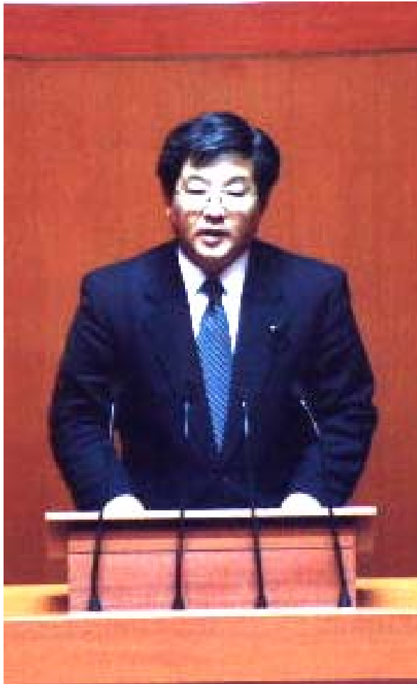
本会議場で教育問題を質す新開県議