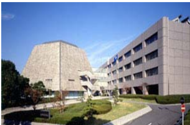
福岡県議会棟を東公園側から望む

県内の実施は、小中学約50%、県立高約33%。来年度には小中学校で授業評価システムのモデルづくりに着手し、すべての県立高校で学校単位の自己評価システムを導入する方針を明らかにした。