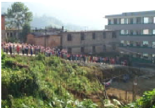
新校舎まで整列して熱烈歓迎してくれた生徒達