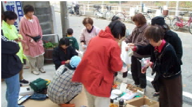
新開県議の自宅前で学校建設バザーを開催

「21 世紀を担う子どもの健全な育成を願う会」は、1999 年 12 月に結成され、日中国交 30 周年を記念して中国に学校を寄贈しようと活動を開始。