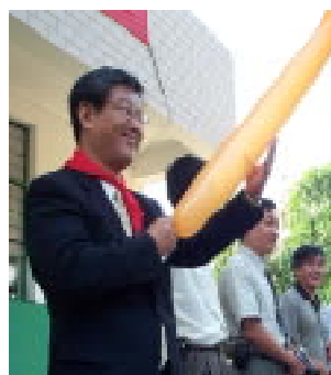
落成を祝して福岡から持参した「ジェット風船」をみんなで大空へ！！