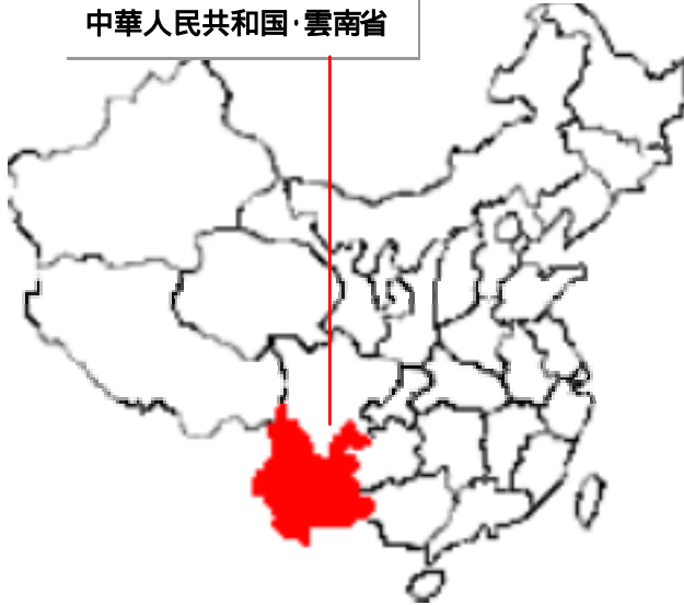
中華人民共和国・雲南省