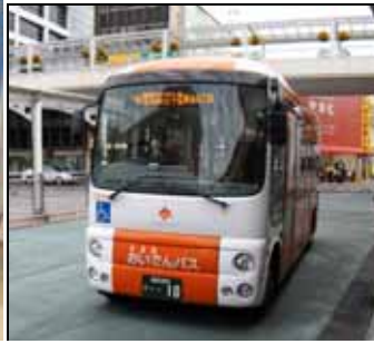
豊田市の生活交通の核「あいでんバス」

福岡では、西鉄バスが不採算路線を廃止、減便を予定。高齢者や障害者の皆さんの生活の足を確保しなければなりません。愛知県豊田市の取組を調査して代表質問に取り入れました。