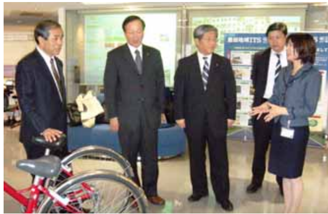
愛知県豊田市「みちなびとよた」で予約バスを調査